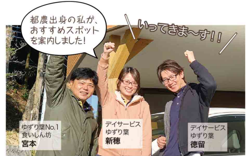
都農出身の私が、おすすめスポットを案内しました!

令和になって初めて迎えた新年に「利用者さんの長寿祈願をやりたい!」と考えていた、ゆずり葉のスタッフたち。県北出身スタッフの「すごい場所がある!」という一言がきっかけで、トントン拍子で「日向」まで行くことに…!? 今号では、長寿祈願スポットと県北出身スタッフのおすすめのお店を紹介させていただきます!